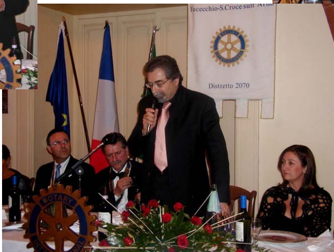
...il saluto del Sindaco