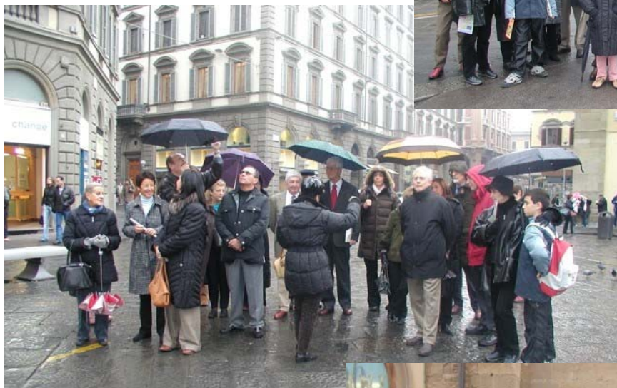
Piazza del Duomo ammirando il campanile...