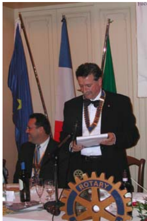
Il gemellaggio ...