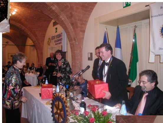
Lo scambio dei doni