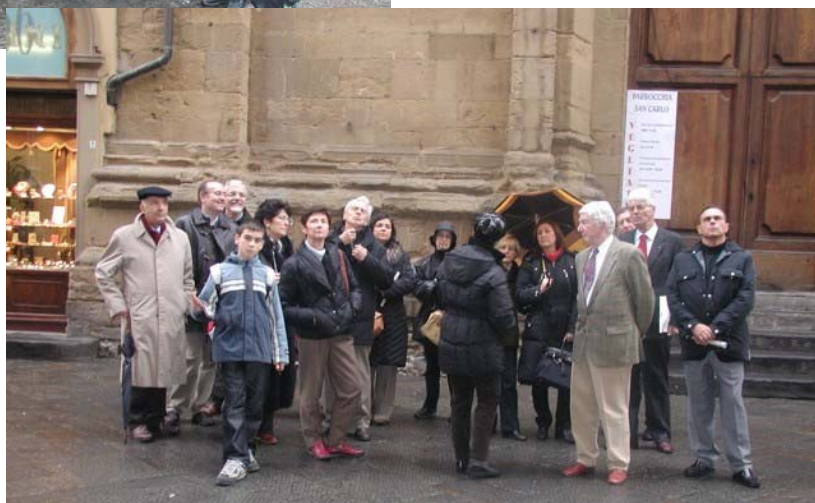
...e Orsanmichele in Via dei Calzaiuoli