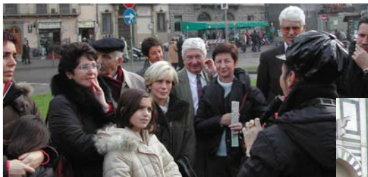
Santa Maria Novella