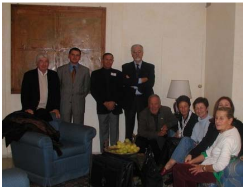
...i primi arrivi

Venerdì 26 Novembre 2004 – La festa del gemellaggio con gli Amici francesi del Rotary Club Cannes Palm Beach ... le immagini più delle parole: