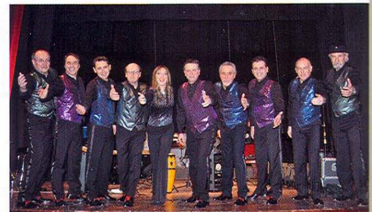
La Rotary Sband

Il ricavato è stato così distribuito: il 25 settembre al Monastero di Santa Cristiana e alla PolioPlus, il 13 febbraio al Fondo Diocesa-