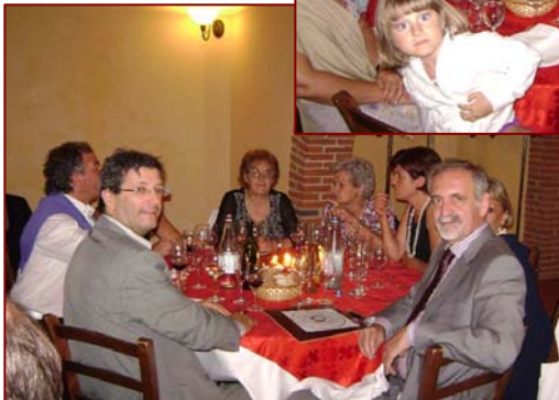
Alcuni soci presenti