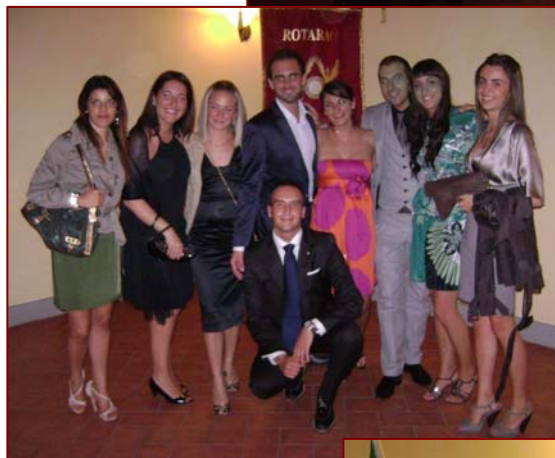
Il nuovo consiglio direttivo