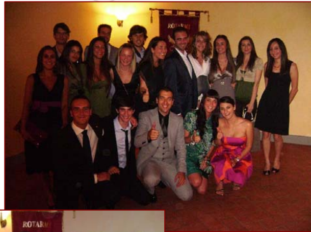
Tutto il Rotaract