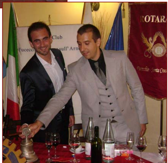
Il passaggio della Campana