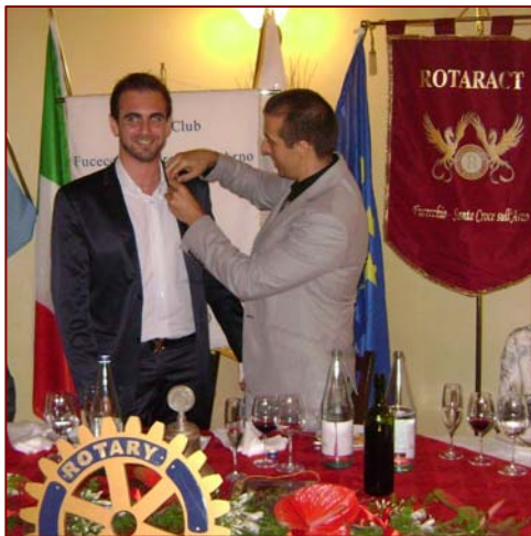
Il passaggio della spilla