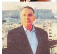
Già socio dal 1979 PHF Past-President 1984/1985